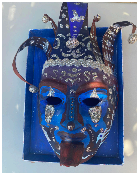
Imagen 2. Paula Ximena Carrillo Briones