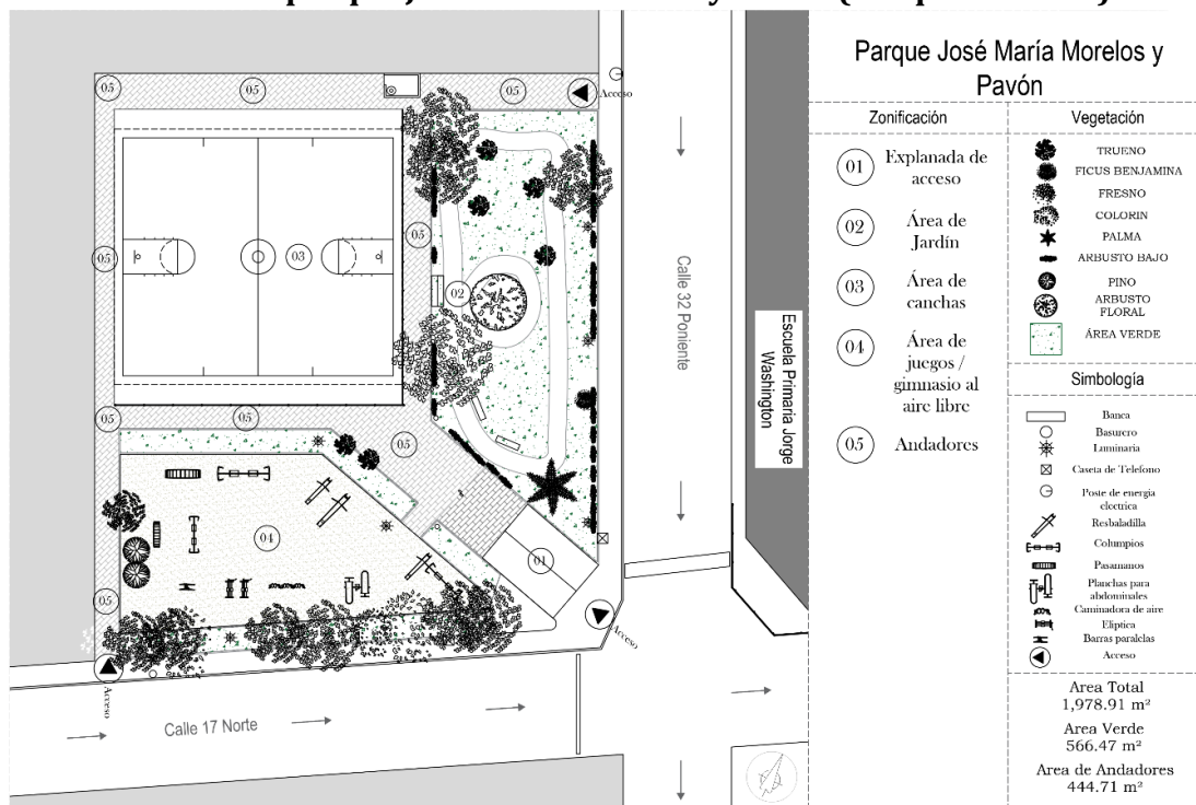
Elaborado en AutoCAD 2018. Levantamiento realizado en 2022. López, 2022.

El parque está estructurado por cinco áreas: 1) explanada de acceso, 2) área de jardín, 3) área de canchas, 4) área de juegos y gimnasio al aire libre, y por último 5) los andadores o área de circulación.