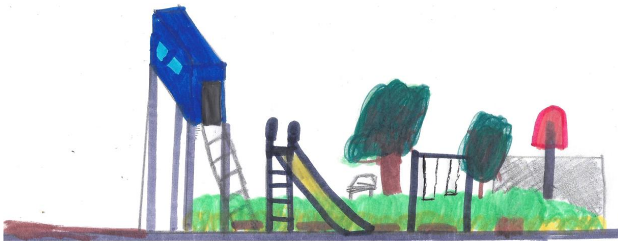
Figura 1. Dibujo del parque Morelos como espacio de juego por parte de un niño (I)

Elaborado con crayones sobre papel.