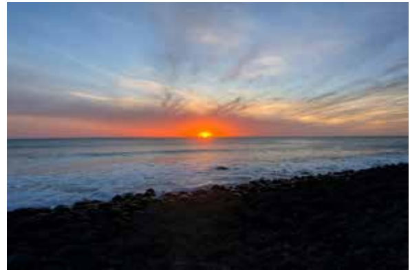
Figura 2: Atardecer en Playa El Vigía, Ensenada, Baja California.

La costa del Pacífico, ubicada en el municipio de Ensenada, es uno de los límites más significativos del estado. Es punto clave para las rutas de aves migratorias y mamíferos marinos, reconocida como región marina por CONABIO (1998) y forma parte de programas de monitoreo acústico de ballenas grises. Este borde representa biodiversidad y conexión histórica entre el puerto, la pesca artesanal y los cambios urbanos en la región, afectada por presiones ecológicas documentadas por IPCC (2022).