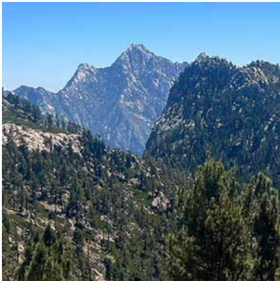
Figura 3: Paisaje montañoso en la Sierra de San Pedro Mártir, Baja California

La Sierra de San Pedro Mártir es uno de los lugares naturales más representativos del norte de México. Declarado Parque Nacional en 1947, alberga ecosistemas de coníferas únicos y especies endémicas como el cóndor de California y el borrego