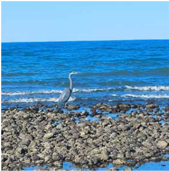
Figura 4: Garza en zona rocosa del litoral en el Golfo de California, Baja California

California (29.7932, -114.3958) Altitud: Nivel del mar Condiciones: Temperaturas entre los 18°C y 32°C, oleaje moderado y vientos desérticos Duración de grabación: tres días, grabaciones diurnas y nocturnas Fecha de grabación: abril de 2025