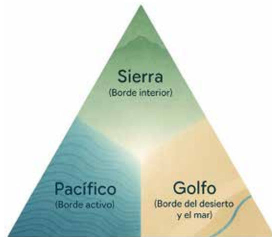
Figura 5: Diagrama del triángulo acústico compuesto por Pacífico, Sierra y Golfo, que ilustra los tres bordes territoriales abordados en la investigación.

La conexión entre tiempo y espacio se vuelve perceptible: cada paisaje sugiere un ritmo diferente, una respiración propia, una forma de vivir el presente. El triángulo acústico de Baja California funciona como un mapa de percepciones que ofrece una lectura alternativa del territorio, complementaria a las aproximaciones cartográficas o visuales convencionales.